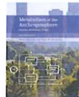
Metabolism of the Anthroposphere